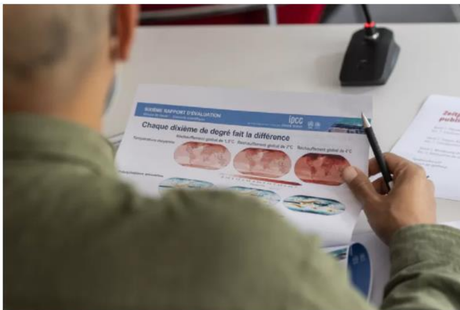
Experts kunnen zich aanmelden om kritisch mee te lezen met een rapport.

Alles is er bij XR op gericht om politiek, bedrijven en burgers aan te sporen tot actie, omdat de leefbaarheid op aarde afkalft als het Parijs-akkoord niet nageleefd wordt en de temperatuur op aarde meer dan 1,5 graden toeneemt. Met die motivatie bracht de Spaanse afdeling van Scientists Rebellion kortgeleden alweer nieuwe teksten van het IPCC in de openbaarheid, uit het rapport waaraan nu wordt geschreven. Dat komt pas in het voorjaar 2022 officieel uit. De gelekte teksten onderstrepen dat de uitstoot van broeikasgassen (CO 2 ) per direct moet dalen, omdat het Parijs-doel anders buiten bereik raakt.